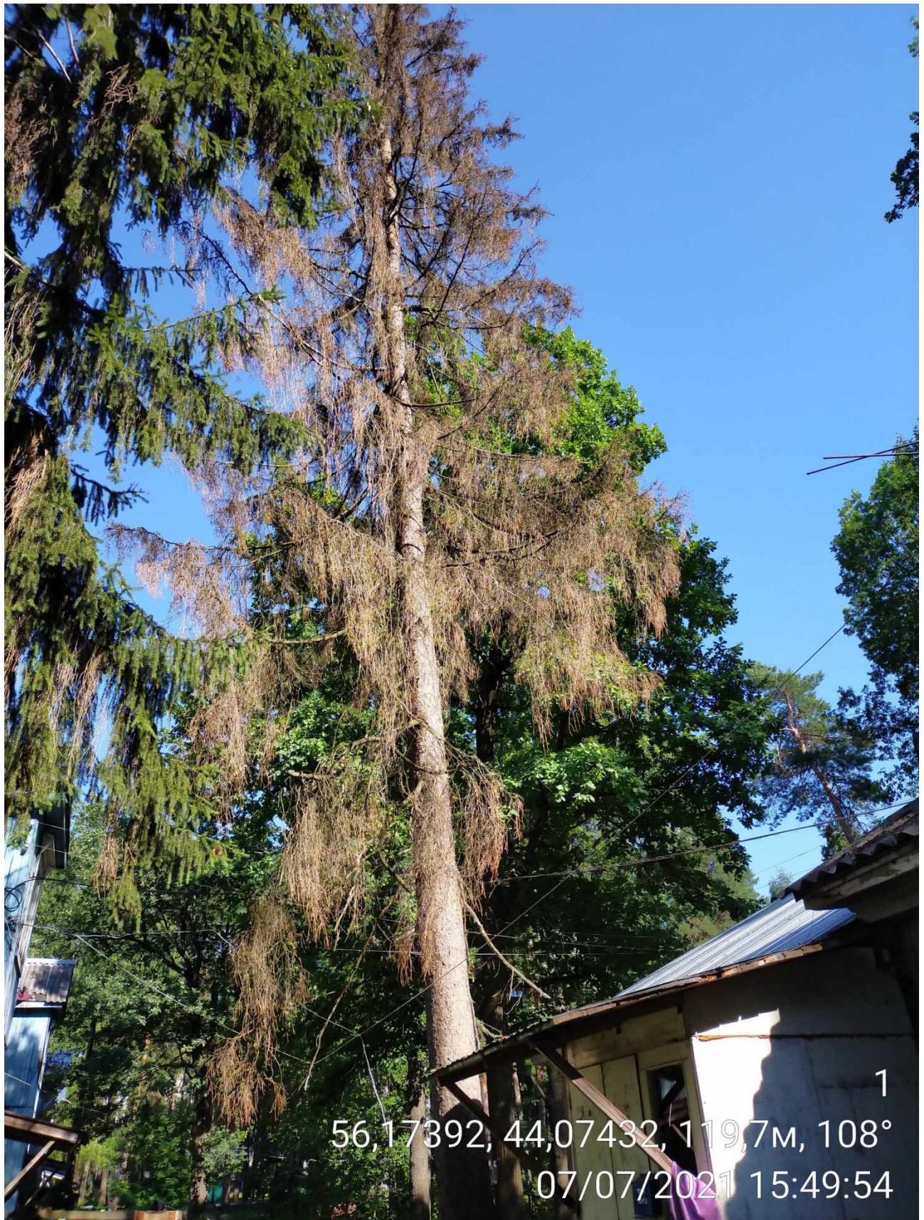
Дерево № 1 (Стволовая гниль)